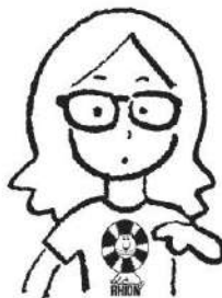
本秀康 Hideyasu Moto

シンガーソングライター。1979年埼玉県生まれ。2024年7月に8作目のアルバム『営業中』をリリース。俳優として映画やドラマへの出演をはじめ、集英社 imidas web にて旅エッセイ「前野健太のガラケー旅日記」を連載するなど文筆活動も行っている。