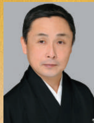
中村雀右衛門 Nakamura Jakuemon

1955年11月20日生まれ。四代目中村雀右衛門の次男。1961年2月に初代大谷広松を名乗り初舞台。1964年9月に七代目中村芝雀を襲名、2016年3月に五代目中村雀右衛門を襲名。屋号・京屋。立女形として真っ直ぐに本道を邁進する。人間国宝であった亡父の大名跡を襲名後、大役に次々挑み芸に磨きをかけている。2008年日本芸術院賞、2010年紫綬褒章、2017年読売演劇大賞優秀男優賞ほか受賞多数。日本俳優協会・理事、伝統歌舞伎保存会・理事。