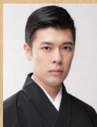
大谷廣松 Otani Hiromatsu

1955年11月20日生まれ。四代目中村雀右衛門の次男。1961年2月に初代大谷広松を名乗り初舞台。1964年9月に七代目中村芝雀を襲名、2016年3月に五代目中村雀右衛門を襲名。屋号・京屋。立女形として真っ直ぐに本道を邁進する。人間国宝であった亡父の大名跡を襲名後、大役に次々挑み芸に磨きをかけている。2008年日本芸術院賞、2010年紫綬褒章、2017年読売演劇大賞優秀男優賞ほか受賞多数。日本俳優協会・理事、伝統歌舞伎保存会・理事。