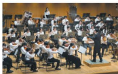
3月 第13回定期演奏会