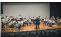
10月 オータムコンサート