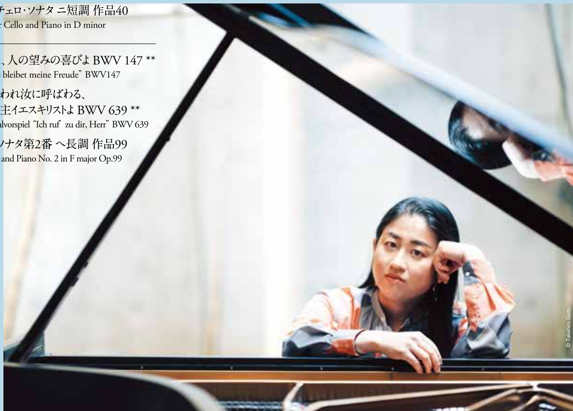
小菅優(ピアノ) Yu Kosuge (piano)