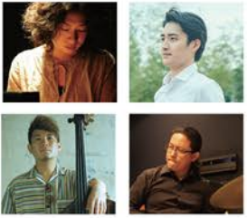
UNT Jazz Quartet