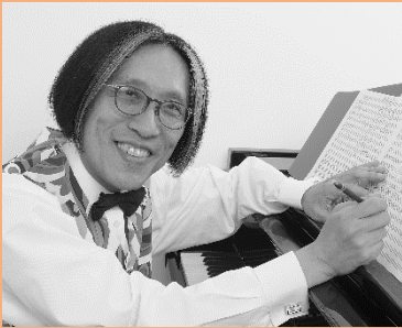
せたがや音楽研究所 宮川彬良 所長

“宮川彬良のせたがや音楽研究所”公演のフィナーレ出演を目的としたワークショップを開催します。 せたがや音楽研究所合唱団の一員 としてステージと一緒に盛り上げてみませんか？ 皆さまのご参加をお待ちしています！