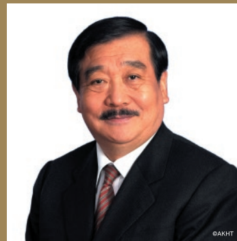
吉村作治 (エジプト考古学者)

古代エジプト文明は、謎めいた巨大なピラミッドやスフィンクスが象徴するように、いつの日も考古学者のみならず、多くの人の心を惹きつけてきました。古代エジプト文明にまつわる物語、そして絶世の美女として知られるクレオパトラなどは、映画、小説はもちろん、音楽の題材として広く扱われています。エジプト考古学者の吉村作治さんをお迎えし、自身もかつてエジプトの仕事に携わったせたおん音楽監督、池辺晋一郎が、自作品をはじめ、エジプトにまつわるいくつかの曲を生演奏でご紹介しながらその魅力に迫ります。