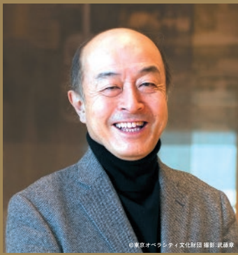
池辺晋一郎 (作曲家)