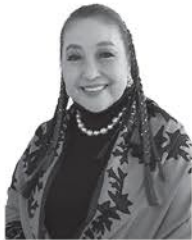
審査員長 湯川れい子 音楽評論家・作詞家

東京都生まれ。ジャズ・ポップスの評論活動を始め、ラジオのDJとして「全米TOP40」を16年間勤め、エルヴィス・プレスリーやビートルズを日本に紹介するなど、独自の視点で国内外の音楽シーンを紹介し現在に至る。60年代「勝ち抜きエレキ合戦」の審査員をするなど、審査員歴は長い。 (公財)せたがや文化財団理事。