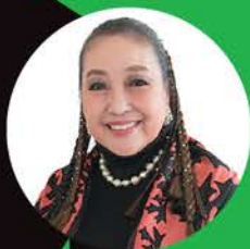
審査員長 湯川れい子 (音楽評論家・作詞家)