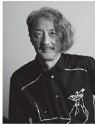
審査員 井上 鑑 作編曲家・キーボード奏者

東京都生まれ。ジャズ・ポップスの評論活動を始め、ラジオのDJとして「全米TOP40」を16年間勤め、エルヴィス・プレスリーやビートルズを日本に紹介するなど、独自の視点で国内外の音楽シーンを紹介し現在に至る。60年代「勝ち抜きエレキ合戦」の審査員をするなど、審査員歴は長い。 (公財)せたがや文化財団理事。