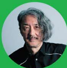
審査員 井上 鑑 (作編曲家・キーボード奏者)