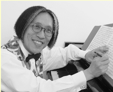
せたがや音楽研究所 宮川彬良 所長

“宮川彬良のせたがや音楽研究所”公演のフィナーレ出演を目的としたワークショップを開催します。 せたがや音楽研究所・合唱団の一員 としてステージと一緒に盛り上げてみませんか？ 皆さまのご参加をお待ちしています！