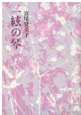
『一絃の琴』（宮尾登美子著） 1978年10月 講談社 第80回直木賞受賞作