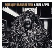
Karel Appel / Musique barbare Sub Rosa 2016年 (CD) LPをCDで再発。絡まったテープを頭からかぶって叫ぶアペルの異様な姿を撮影したのは同郷の写真家のエルスケン。彼の短編映画「Karel Appel, Componist」はYouTubeで視聴できる。